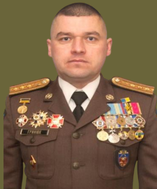
полковник ГРИНЮК Володимир Володимирович Герой України Орден Б. Хмельницького III ст