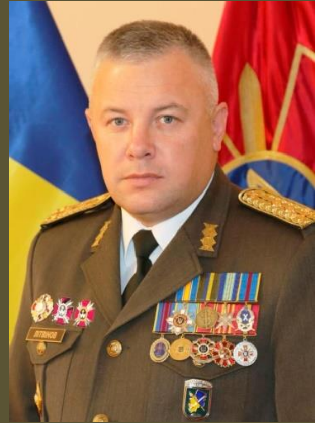
Заступник начальника Національного університету оборони України генерал-майор ЛІТВІНОВ Сергій Петрович

З метою формування боєздатного мобілізаційного резерву Збройних Сил України, всебічної підготовки студентів, виховання у них військово-професійних, морально-психологічних та патріотичних якостей, виховання почуття обов'язку та готовності до захисту України, а також забезпечення реалізації права громадян на рівні можливості в виборі професії шляхом здобуття додаткових знань, кафедра військової підготовки Національного університету оборони України проводить військову підготовку громадян України за програмою підготовки офіцерів запасу для забезпечення Збройних Сил України необхідною кількістю військовонавчених громадян для проходження військової служби та виконання ними військового обов'язку.