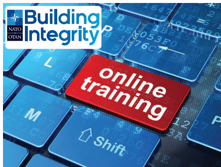
Курс НАТО з підвищення рівня обізнаності про виховання доброчесності

Особовий склад, залучений до діяльності, в якій існує ризик виникнення корупції, повинен підвищити свою обізнаність про «корупційні ризики» за допомогою: