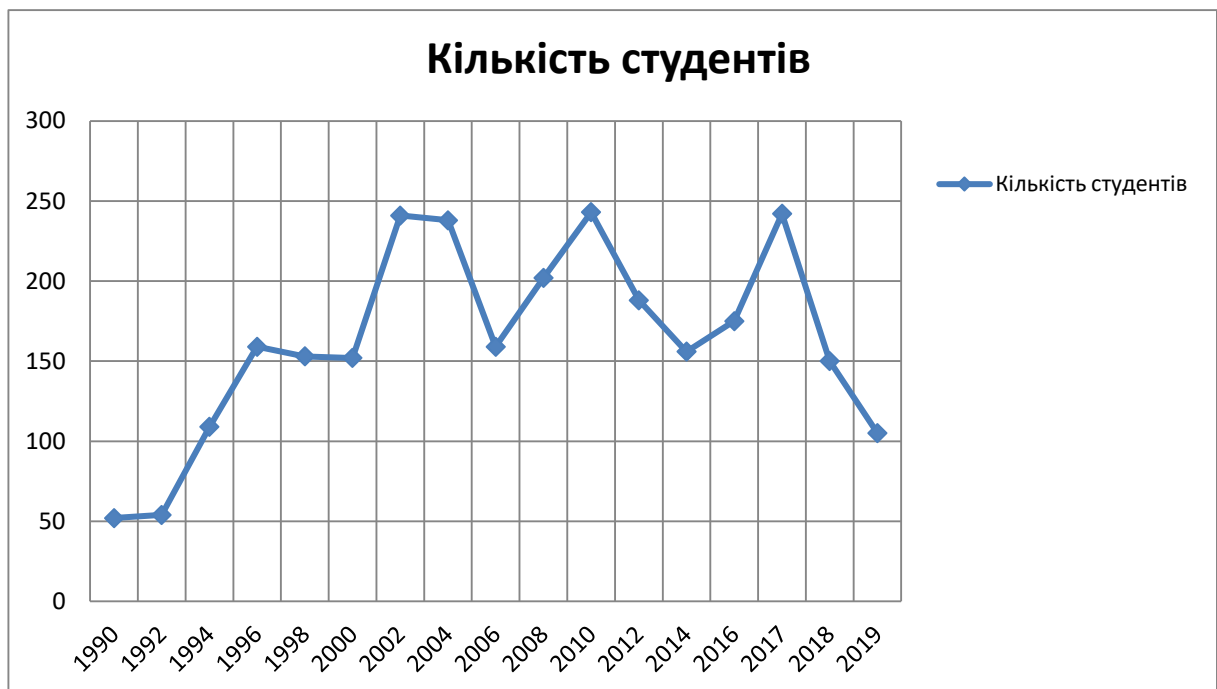
Рис. 2 Графік набору студентів на навчання за тиловою військово-обліковою спеціальністю

Результати здійсненого аналізу по роках набору студентів на навчання (рис.2) дозволяють зробити висновок, що перш за все вплив на бажання студентів проходити військову підготовку здійснювали та продовжують законодавчі акти щодо переходу комплектування Збройних Сил України на контрактній основі, скорочення чисельності Збройних Сил України і відсутність потреби великої кількості офіцерів запасу. Прикладом може слугувати відміна строкового призову навесні 2013 року, яка привело до зменшення набору студентів майже втричі у порівнянні з попередніми роками.