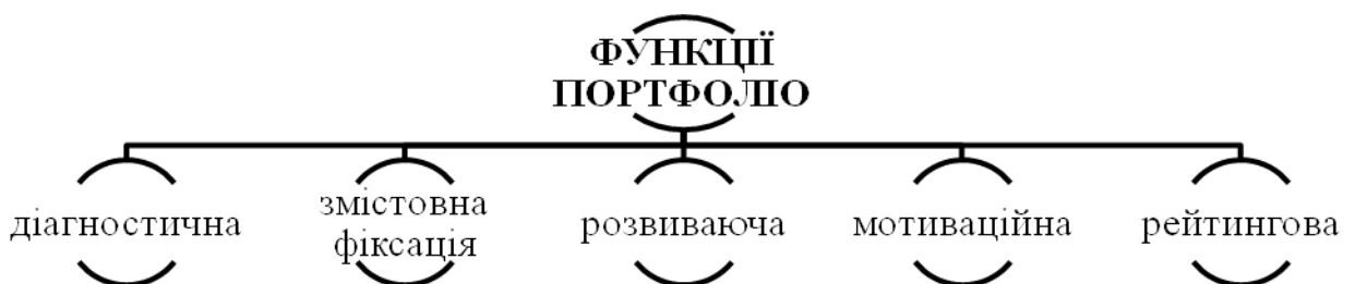
Рис.1 Функції портфоліо як інноваційного методу підготовки громадян України за програмою підготовки офіцерів запасу

Портфоліо, як і будь-який метод навчання має відповідні функції (рис. 1), які в свою чергу забезпечують ефективний та результативний освітній процес громадян України за програмою офіцерів запасу.