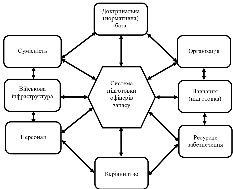
Рисунок 1 – Показники ефективності функціонування системи підготовки громадян України за програмою підготовки офіцерів запасу.

Показники ефективності функціонування системи підготовки громадян України за програмою підготовки офіцерів запасу схематично показано на (рис. 1).