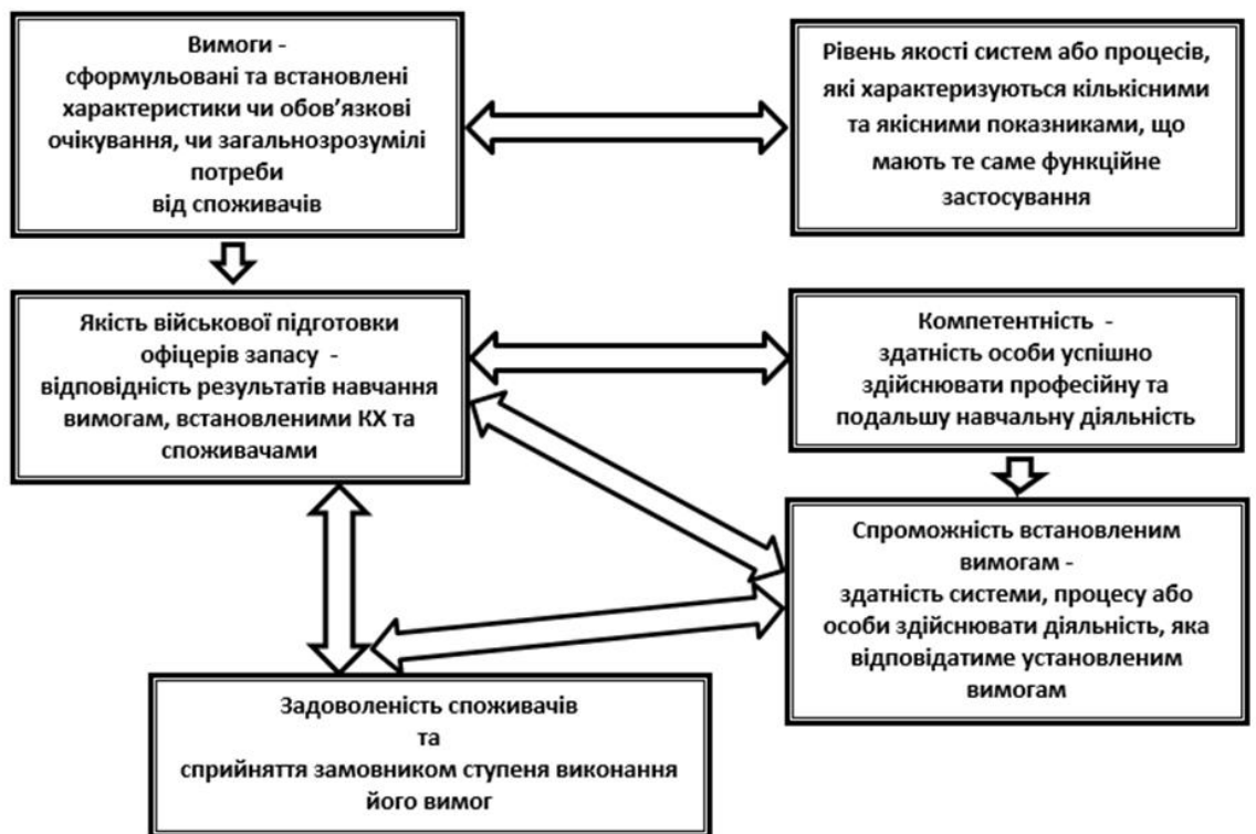
Рисунок 1 – Система понятійних тематичних угруповань, які розкривають сутність поняття “якість підготовки офіцерів запасу”.

Дана схема відображає систему тематичних угруповань відповідного понятійно-категорійного апарату “якість підготовки офіцерів запасу” і містить сукупність складових, які певним чином пов'язані між собою та демонструє їх взаємозв'язок і взаємовплив. Споживачами результатів діяльності є держава, суспільство, замовники, студенти. Чим краще кафедра військової підготовки зможе визначити вимоги та потреби усіх категорій споживачів, тим більше ймовірність організувати свою діяльність так, щоб максимально якісно задовольнити їх вимоги і очікування. Постійний зв'язок зі споживачами, оцінювання ступеню їх задоволеності освітньою діяльністю є визначальним для успішності на ринку освітянських послуг.