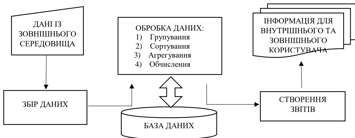
Рис. 1 – Основні компоненти інформаційної технології обробки даних

Тому впровадження інформаційних технологій і систем на цьому рівні істотно підвищить продуктивність працівників вищих військових навчальних закладів, при підготовки офіцерів запасу, звільнить їх від рутинних операцій та визначить вимоги до професійних якостей, знань і умінь офіцера запасу.